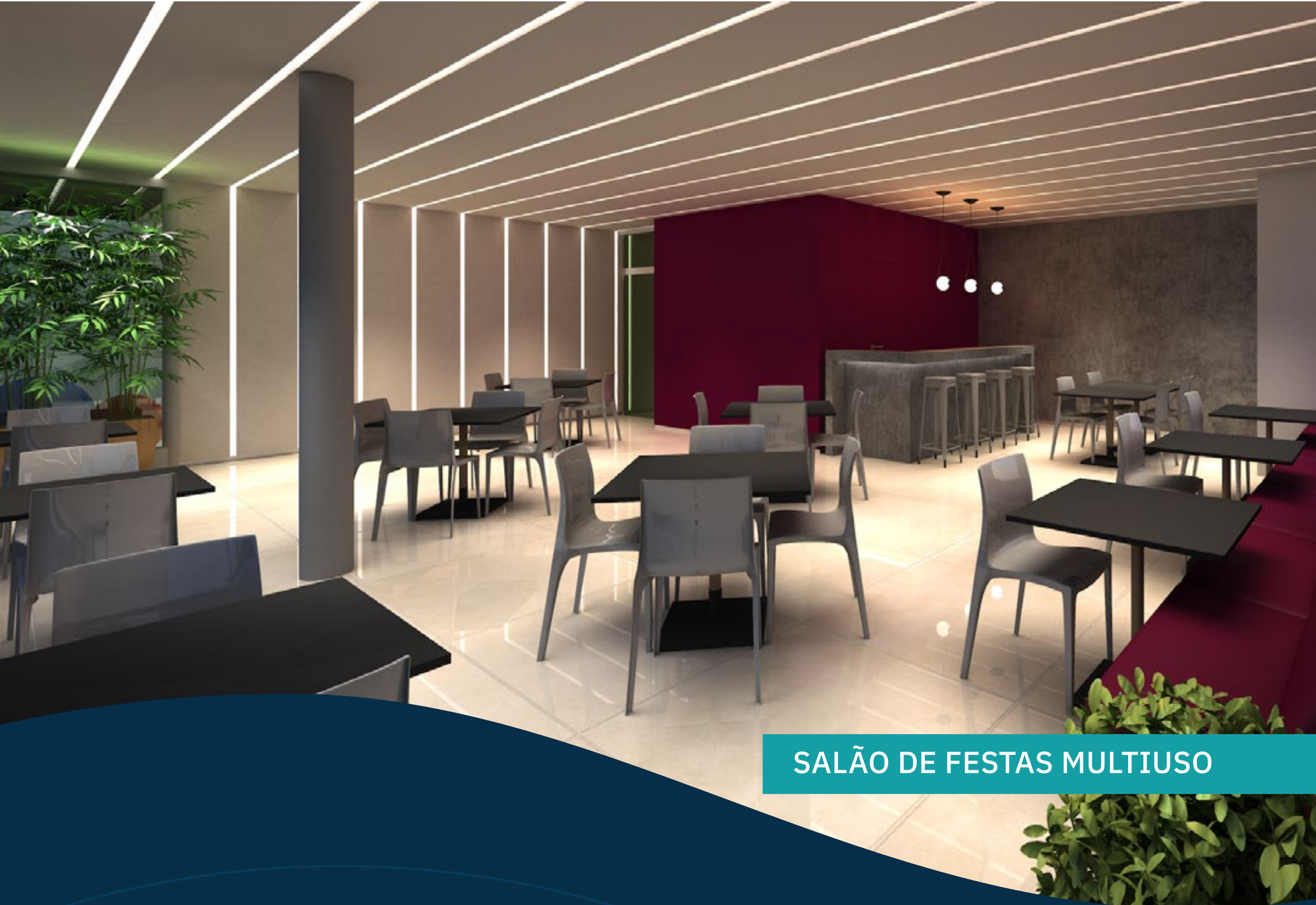
SALÃO DE FESTAS MULTIUSO

Receber bem quem a gente ama é exercitar o coração.